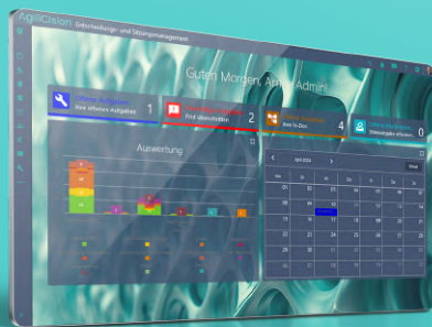
Wichtiges im Fokus

AgiliCision ist Ihre All-in-One-Lösung für digitales Entscheidungs- und Sitzungs- management und effiziente Meetings.